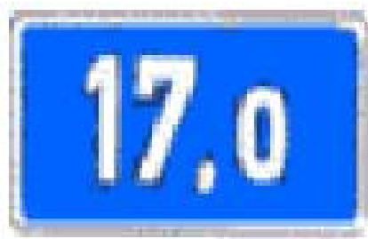
Hinweisschild für Autobahnkilometer 17,0

Mein Name ist Max Mustermann, es ist ein Verkehrsunfall mit 3 Fahrzeugen auf der A99 in Fahrtrichtung Salzburg passiert. Es sind 4 Personen verletzt, 2 davon sind nicht mehr ansprechbar und in ihren Fahrzeugen eingeklemmt. Der Unfall ist bei Autobahnkilometer 38,5 passiert, zwischen dem Autobahnkreuz München Ost und der Ausfahrt Haar in Höhe der Rastanlage Vaterstetten West!